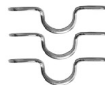
Attache de poulie