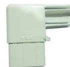
Les angles du rail avant

Si vous avez tout identifié, si vous avez tous les outils sous la main, et que la bière est au frigo, on peut y aller..