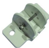
Les Supports de Guides